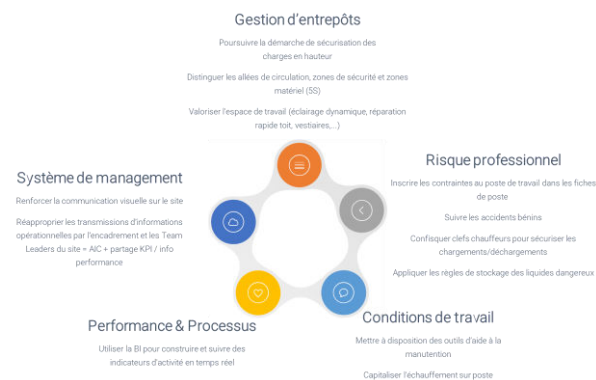
Extrait d'une aide à la définition des chantiers prioritaires